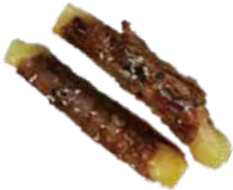
55: Yakiniku ternera y queso a la plancha