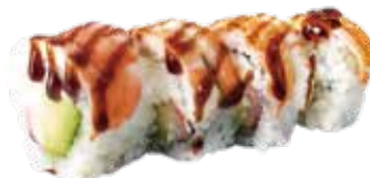
102: California relleno de surimi y aguacate con philadelphia recubierto con gambas de sushi (4u)