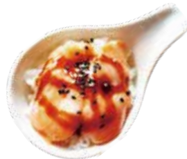
83: Chirashi de salmón