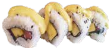
156: Rollo de mango y atun (4u)