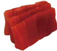
130: Sashimi atún (3p)