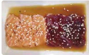
149: Carpaccio mixto (salmón y atún con salsa ponzu)