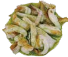
42: Sepia a la plancha