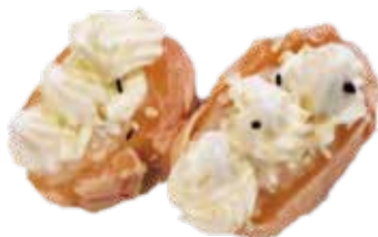
147: Gunkan de salmón flameado y philadelphia (2p)