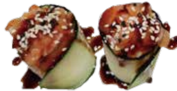
98: Gunkan de pepino y salmón