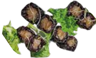
77: Maki de salmón en arroz negro(8u)