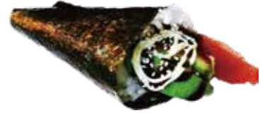
89: Temaki de atún picante