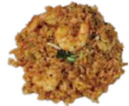
10: Arroz con gambas y verduras