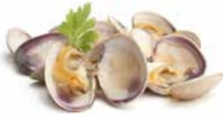
56: Almeja cocido