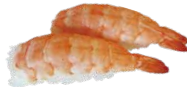
65: Nigiri gambas (2u)