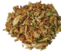
9: Arroz con pollo y verdura