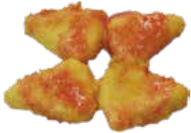
23: Queso fritas