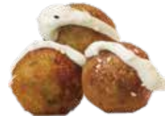
27: Bolas de pulpos fritos