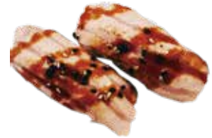
127: Nigiri salmón flameada (2u)