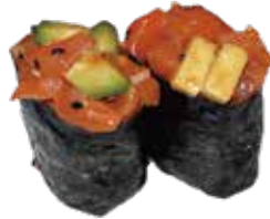
92: Gunkan shake de salmón y aguacate (2u)