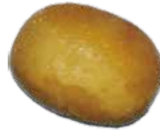
17: Pan japones