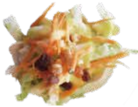
1: Ensalada de frutas secas