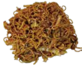
12: Yakisoba con verduras