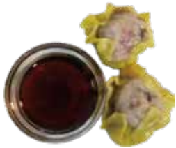
32: Sau Mai al vapor