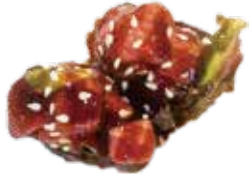
95: Gunkan de atún picante (2u)