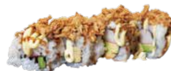
103: California relleno de surimi y aguacate con philadelphia encima con cebolla frita (4u)

POR FAVOR NO DESPERDICIA LA COMIDA, SI NO HABRA QUE ABONAR 3.00€ POR PLATO