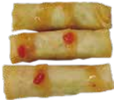
19: Rollitos de verduras fritas