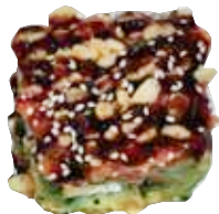
122: Tarta salmón aguacate y arroz frito