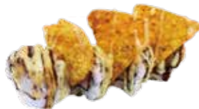
117: Rollo de nacho picante (4u)