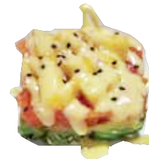
121: Tarta salmón aguacate y mango con salsa mango