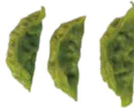
30: Empanadillas (gyoza) de verduras al vapor