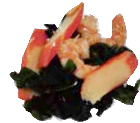
6: Ensalada de la casa