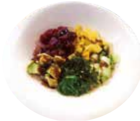
139: Poké de atún 1 base de arroz, mango wakame, aguacate, pepino, sésamo