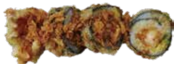
119: Futomaki frito con tempura de langostino (4u)