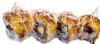
151: Rollo de pollo kimono, philadelphia, lechuga, recubierto con queso flameado y kataifi (4u)