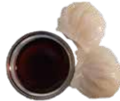
57: Gyoza de gambas al vapor