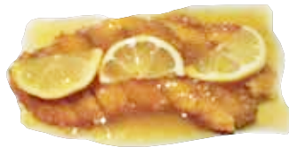
47: Pollo limon