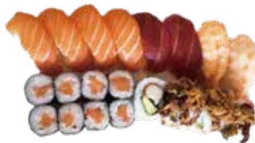
70: Sushi mixto (Hosomaki salmón 8u, 8u nigiri de 4 salmón, 2 atún, 2 gambas 4 uramaki de california)

POR FAVOR NO DESPERDICIA LA COMIDA, SI NO HABRA QUE ABONAR 3.00€ POR PLATO