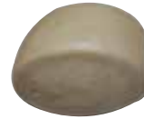
44: Pan japonés al vapor