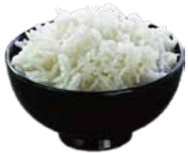
11: Arroz blanco