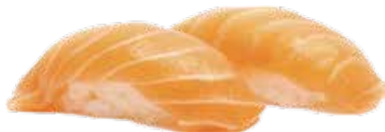
64: Nigiri salmón (2u)