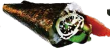
87: Temaki de atún