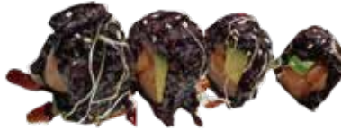
105: Roll de salmón y aguacate en arroz negro (4u)