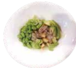
61: Ensalada de pollo con aguacate, lechuga y edamame