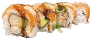
101: California relleno de surimi y aguacate con philadelphia recubierto salmón (4u)