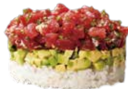
124: Tarta de atun aguacate y arroz