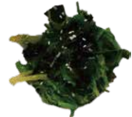
4: Ensalada de algas wakame