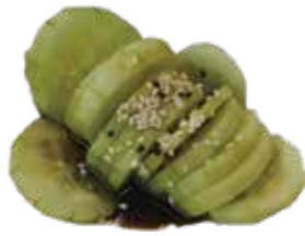
2: Ensalada de pepino