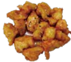
34: Bolas de pollo fritas