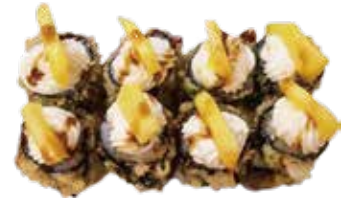
134: Maki de salmón frito arriba con philadelphia y mango