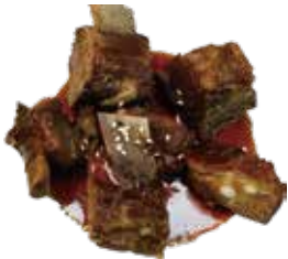
28: Costilla de cerdo asadas