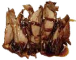
51: Pato asado frito