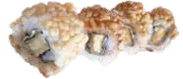
107: Rollo de pollo kimono, philadelphia, lechuga y recubierto de arroz frito (4u)