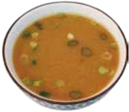
7: Sopa miso