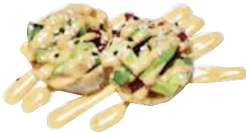
66: Taco atún y aguacate con salsa picante