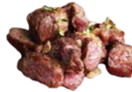
53: Entrecot a la plancha