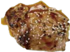
36: Solomillo de Ibérico a la plancha