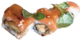
108: Rollo de pollo kimono, philadelphia, lechuga, cubierto con salmón y kataifi (4u)