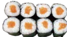
73: Maki salmón ahumado (8u)