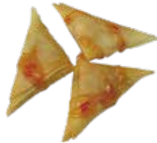
20: Enpanadillas de curry fritas