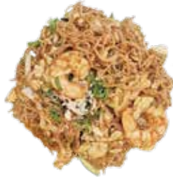
16: Fideos de arroz frito con verduras y gambas