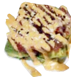
125: Tarta de atún y aguacate con salsa picante

POR FAVOR NO DESPERDICIA LA COMIDA, SI NO HABRA QUE ABONAR 3.00€ POR PLATO