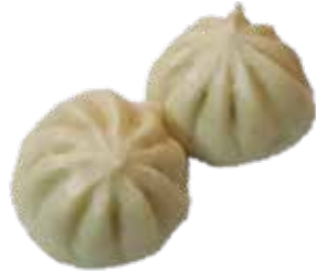
33: Xiao Long Bao al vapor