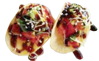
160: Taco crispy salmón aguacate massago con salsa anguila

POR FAVOR NO DESPERDICIA LA COMIDA, SI NO HABRA QUE ABONAR 3.00€ POR PLATO