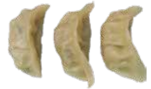
31: Empanadilla (gyoza) de carne al vapor

POR FAVOR NO DESPERDICIA LA COMIDA, SI NO HABRA QUE ABONAR 3.00€ POR PLATO