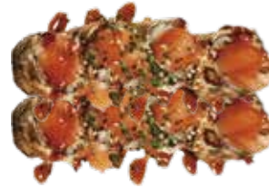
133: Maki de salmón frito arriba con tarta de salmón y pasta kataifi