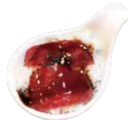
84: Chirashi de atún