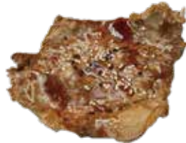
37: Bistec de ternera a la plancha