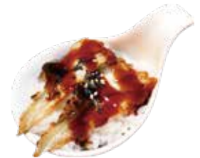
85: Chirashi de anguila