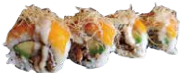
112: Rollo de salmón asado , aguacate con Philadelphia cubierto de queso flameado (4u)