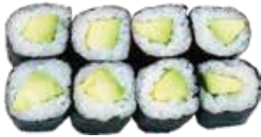
76: Maki aguacate (8u)