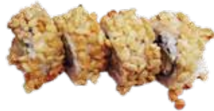
109: Rollo de ebi tem con tempura de langostino, philadelphia, lechuga y cubierto de arroz frito (4u)