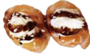
93: Gunkan de salmón ahumado y philadelphia (2u)