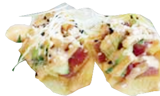
159: Taco crispy taco atún aguacate con salsa picante