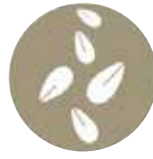
Granos De sésamo