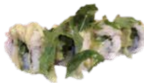
118: Rollo vegetariano de espárrago (4u)