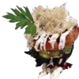
123: Tarta de salmon y aguacate con arroz negro