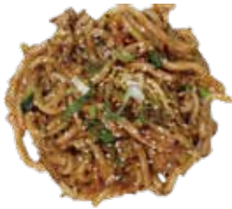
15: Udon frito con verduras y gambas