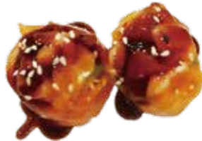
96: Gunkan de salmón picante con trocitos de salmón (2u)