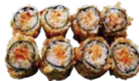
81: Maki salmón frito con kataifi