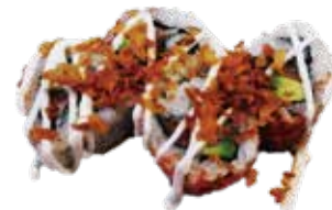
138: Shake humado (relleno salmón humado queso pepino y sesamo recubierto)

POR FAVOR NO DESPERDICIA LA COMIDA, SI NO HABRA QUE ABONAR 3.00€ POR PLATO