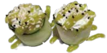
99: Gunkan de pepino y Philadelphia