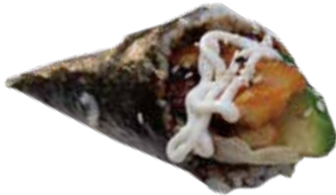
90: Temaki de pollo kimono