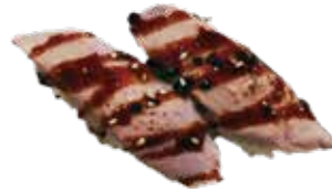
126: Nigiri atún flameada (2u)