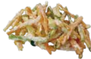
21: Tempura de verduras fritas