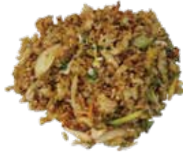
8: Arroz con verduras