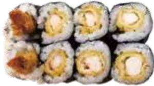
131: Maki de tempura de langostino (8u)