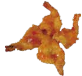
22: Langostino en kimono