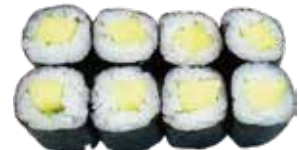
75: Maki mango (8u)