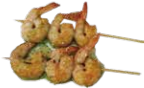
40: Pinchos de gambas