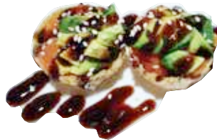
67: Taco salmón y aguacate con salsa anguila