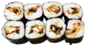
79: Maki de anguila (8u)