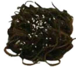
3: Ensalada de algas de la casa picante