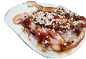
137: Chirashi de pato