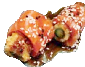
153: Rollo de espárragos y salmón