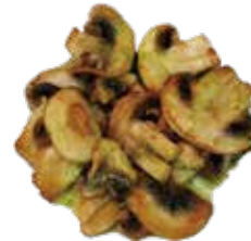
38: Champiñones a la plancha