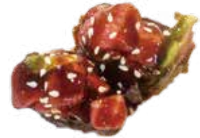
94: Gunkan de atún (2u)