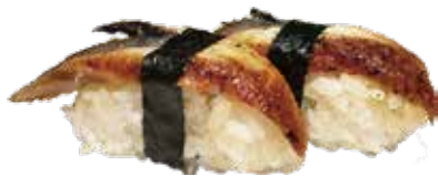
68: Nigiri anguila (2u)