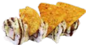
116: Rollos de nachos (4u)