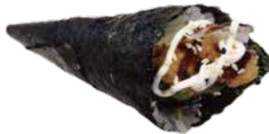
135: Temaki de tempura de langostino