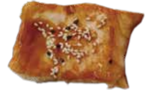
35: Salmón a la plancha