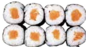
72: Maki salmón (8u)