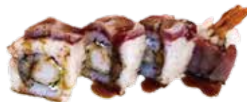
157: Rollo de ebi ten cubierto de atún flameado (4u)