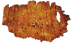
24: Pollo en kimono