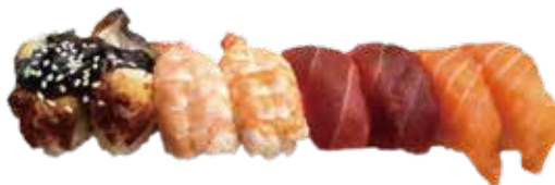
69: Nigiri mixto (Salmón 2u, atún 2u, gambas 2u, anguila 2u) (total 8u)