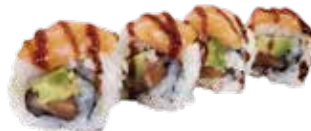
114: Rollo de salmón con aguacate recubierto de salmón