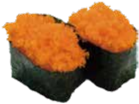
91: Gunkan masago de huevas cangrejos (2u)