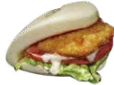
26: Pan bao de pollo