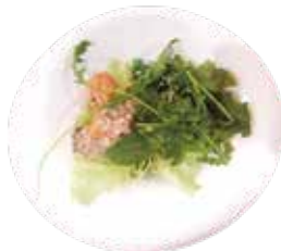
60: Ensalada de salmón con lechuga, aguacate y pepino