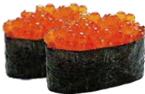
146: Gunkan ikura de huevos salmón (2p)