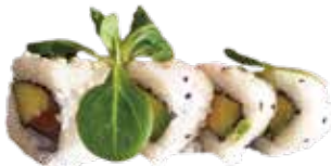
113: Rollo de salmón con aguacate y arriba sésamo (4u)