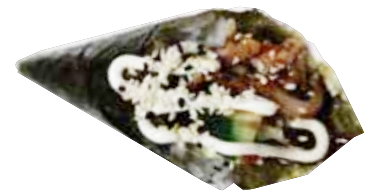
136: Temaki de pato

POR FAVOR NO DESPERDICIA LA COMIDA, SI NO HABRA QUE ABONAR 3.00€ POR PLATO