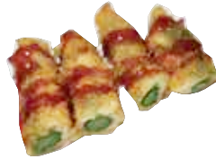
52: Esparraco frito