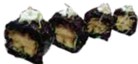
145: Roll de pollo kimono en arroz negro (4u)