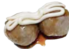
49: Albontica ternera estilo japonés