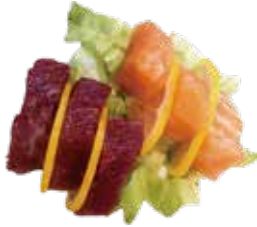
128: Sashimi mixto (6p)