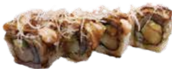
100: California relleno de surimi, aguacate, philadelphia con salmón flameado y catafi (4u)