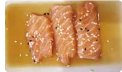
150: Llosas de salmón con salsa de ponzu