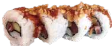
155: Spicy maguro atun mallonesa y pepino (4u)