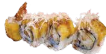
152: Rollo de tempura langostino cubierto de queso flameado y kataifi (4u)