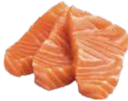
129: Sashimi salmón (3p)