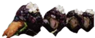
144: Roll de tempura de langostino en arroz negro (4u)