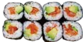
80: Maki de salmón y aguacate (8u)