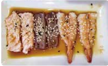
148: Carpaccio mixto flameado (salmón, atún gambas 6p)