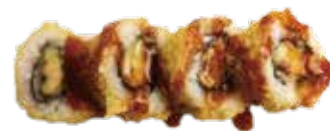
115: Uramaki frito relleno de plátano y queso (4u)