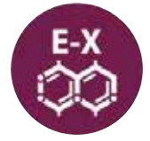
Dióxido de azufre y sulfitos