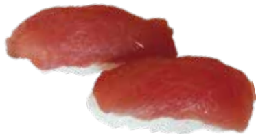
63: Nigiri atún (2u)