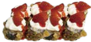
132: Maki de salmón frito con philadelphia y fresa arriba