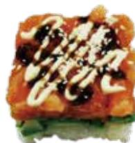
120: Tarta de salmon arroz y aguacate