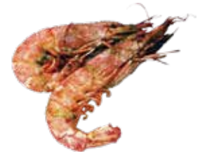
50: Langostino a la plancha

POR FAVOR NO DESPERDICIA LA COMIDA, SI NO HABRA QUE ABONAR 3.00€ POR PLATO