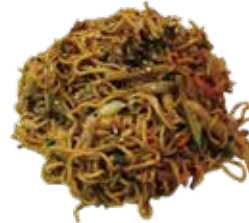
13: Yakisoba con verduras y pollo