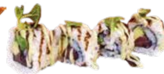
158: Rollo de atún y aguacate (4u)