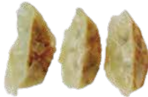
29: Empanadillas (gyoza) a la plancha