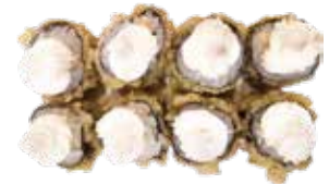
82: Maki de salmón frito con philadelphia y kataifi arriba

POR FAVOR NO DESPERDICIA LA COMIDA, SI NO HABRA QUE ABONAR 3.00€ POR PLATO