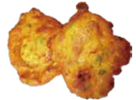
45: Tortillas de gambas frito