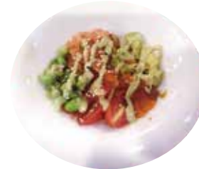
142: Poke de salmón base de arroz, aguacate, edamames masago y frutaseco