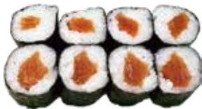
71: Maki atún (8u)