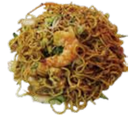
14: Yakisoba con verduras y gambas

POR FAVOR NO DESPERDICIA LA COMIDA, SI NO HABRA QUE ABONAR 3.00€ POR PLATO