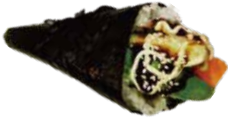
86: Temaki de salmón