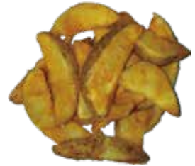
18: Patatas bravas