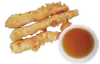
58: Tempura de langostino