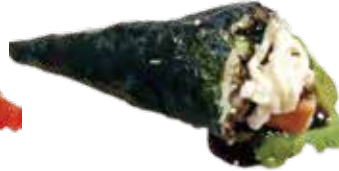
88: Temaki de salmón picante